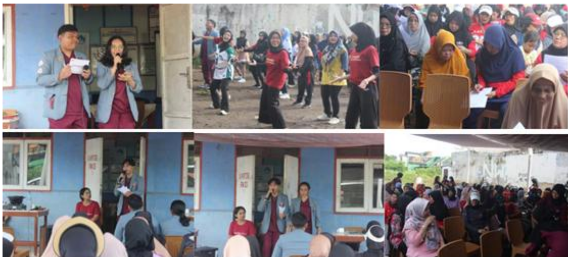
Gambar 2. Kegiatan Pemberdayaan Masyarakat melalui Edukasi Kesehatan Jiwa dan Terapi Mindfulness Berbasis Komunitas

Pelaksanaan kegiatan masih menghadapi beberapa kendala, antara lain rendahnya literasi kesehatan mental, stigma publik terhadap gangguan jiwa, serta keterbatasan keterampilan praktis masyarakat dalam melakukan intervensi psikologis sederhana. Temuan ini sejalan dengan penelitian sebelumnya yang menyebutkan bahwa stigma dan minimnya edukasi menjadi penghambat utama dalam upaya peningkatan kesehatan jiwa berbasis komunitas (Danukusumah, Suryani, & Shalahuddin, 2022; Puspitasari et al., 2024)