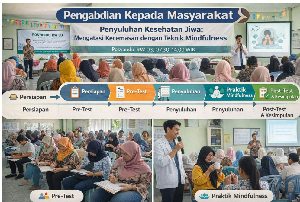
Gambar 1. Metode Pelaksanaan Kegiatan Pengabdian Kepada Masyarakat

Evaluasi efektivitas kegiatan dilakukan melalui post-test untuk menilai perubahan pengetahuan peserta setelah intervensi edukatif. Kegiatan diakhiri dengan penyampaian kesimpulan oleh narasumber dan penutupan oleh ketua panitia. Seluruh rangkaian metode pelaksanaan ini dirancang untuk mendorong partisipasi aktif masyarakat serta memastikan keberlanjutan penerapan keterampilan pengelolaan kecemasan di lingkungan komunitas.